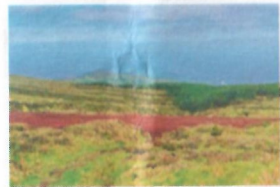
Vista para os Capelinhos View to Capelinhos