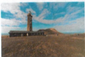
Centro Interpretação Vulcão Capelinhos Capelinhos Volcano Interpretation Centre