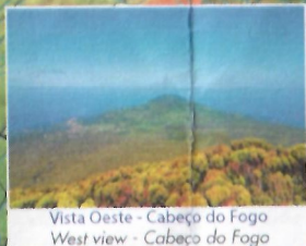
Vista Oeste - Cabeço do Fogo West view - Cabeço do Fogo