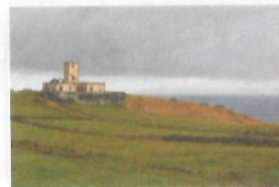
Farol da Ribeirinha Ribeirinha lighthouse